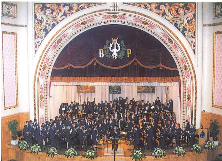
西班牙利比亚原始队